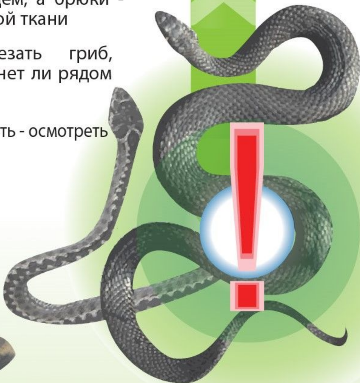
Обыкновенная гадюка единственная ядовитая змея